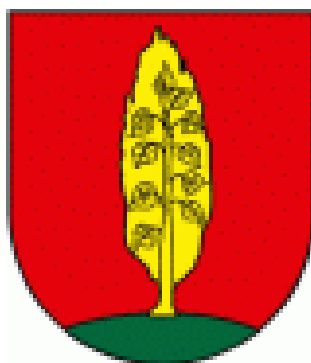
Obrázok 2 Erb Obce Topoľa

Erb obce – V červenom štíte zo zelenej pažite vyrastajúci zlatý prirodzený topol' s kresbou kmeňa a listov. Prírodný a zároveň hovoriaci symbol, podľa odtlačku pečatidla obce z druhej polovice 18. storočia.